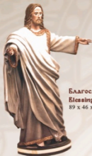
Благословляющий Христос Blessing Jesus Christ 89 x 46 x 46 cm / 35 x 18 x 18 in