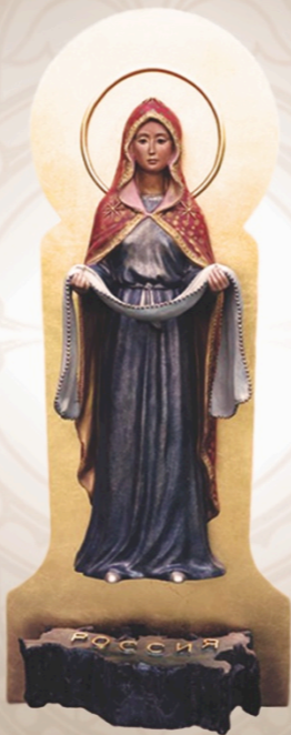
Россия под Покровом Пресвятой Богородицы Virgin Mary protecting Russia 74 x 25 x 20 см / 29 x 10 x 8 in