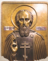
Сергий Радонежский (базельеф) Sergius of Radonezh (bas-relief) 64 x 56 x 13 cm / 25 x 22 x 5 in