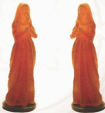
Молящаяся Дева Мария Praying Virgin Mary 81 x 28 x 25 см / 32 x 11 x 10 in