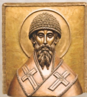
Спиридон Тримифунтский (базельеф) Saint Spiridon (bas-relief) 64 x 56 x 13 cm / 25 x 22 x 5 in