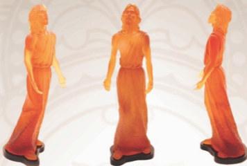
Молящийся Иисус Praying Jesus 86 x 28 x 30 см / 34 x 11 x 12 in