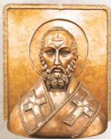
Николай Чудотворец (базельеф) Saint Nicholas (bas-relief) 64 x 56 x 13 cm / 25 x 22 x 5 in