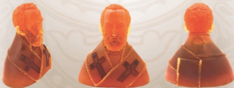
Николай Чудотворец Saint Nicholas 53 x 58 x 30 см / 21 x 23 x 12 in